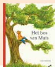
Het bos van Muis - William Snow