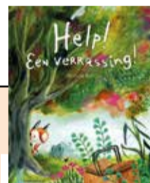
Help! Een verrassing! - Miriam Bos