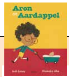
Aron en Aardappel - Josh Lacey