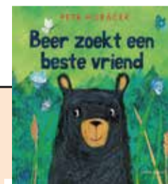
Beer zoekt een beste vriend - Petr Horáček