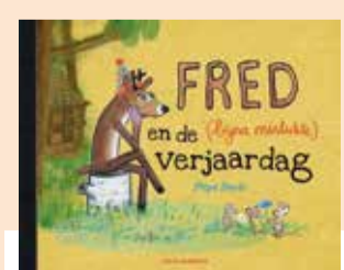
Fred en de (bijna mislukte) verjaardag - Pèpé Smit