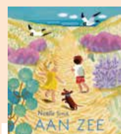
Aan zee - Noëlle Smit