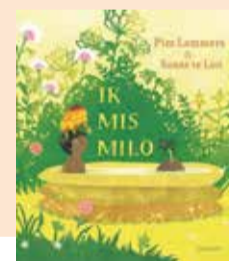
Ik mis Milo - Pim Lammers